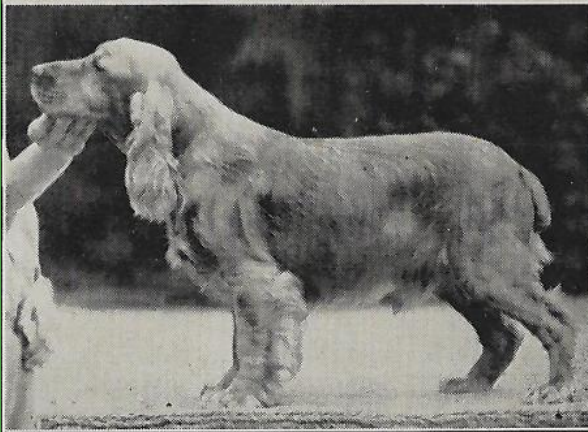
Oben: Die Hündin, unten; der Rüde. — Die Hündin ist die bessere von den beiden, aber ihre Pluspunkte kommen durch die lange Jacke und das tote Haar nicht zur Geltung. Der Rüde ist fertig gemacht zur Vorführung im Ausstellungsring.